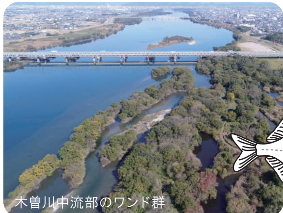
木曾川中流部のワンド群

イタセンパラ(コイ科タナゴ亜科)は、二枚貝に産卵する日本固有のタナゴ類の1種です。分布は濃尾平野を含む国内3地域に限られ、いずれの地域においても絶滅が危惧されており、国の天然記念物に指定されています。