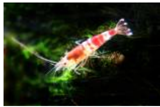
レッドビーシュリンプ