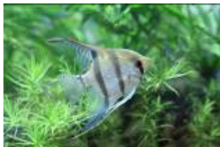
エンゼルフィッシュ